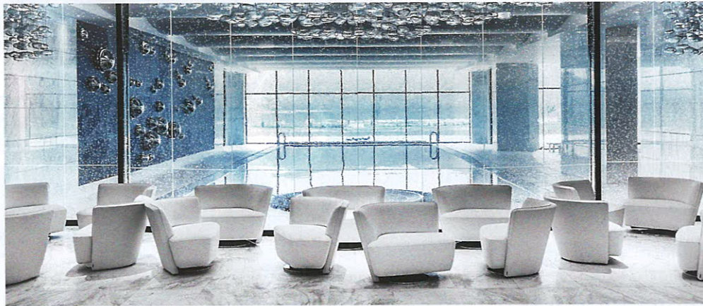
Летом стеклянная стена бассейна поднимается

БОЛЬШЕ ВСЕГО НА ТЕРРИТОРИИ ОТЕЛЯ ПОРАЖАЮТ ТЫСЯЧИ РОЗОВЫХ КУСТОВ, РАССАЖЕННЫХ ПО ВСЕМУ ПАРКУ